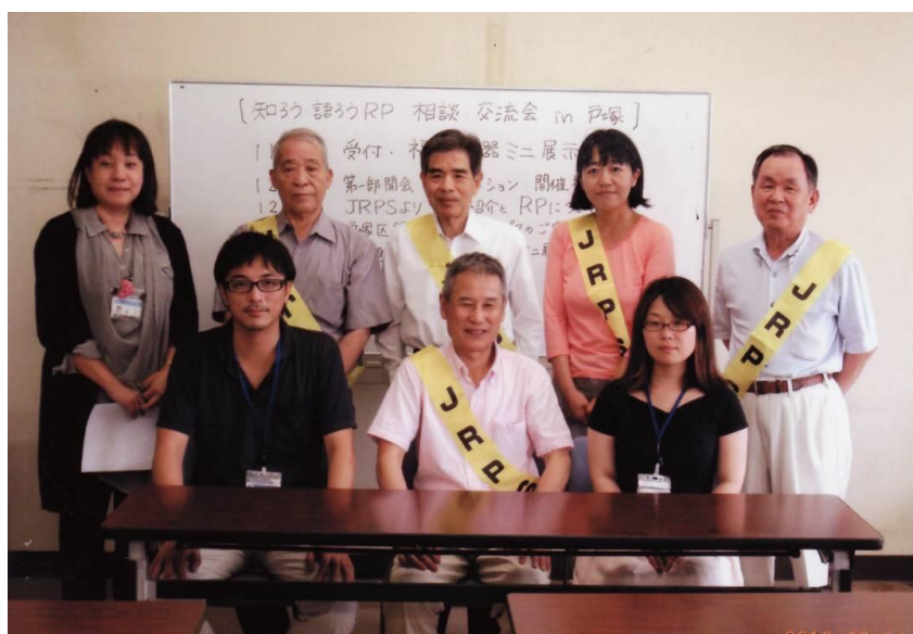
横浜市戸塚福祉保健センターと JRPSスタッフの皆さん

なお、毎年国が実施している特定疾患の“RP”に関する調査に個人調査票があり、眼科医が記載する診断項目の最初の方に病型分類があり、1.孤発性、2.常染色体優勢遺伝型など5型式が書かれた部分があり、1.孤発性に印がある方は今お話した内容に該当しています。