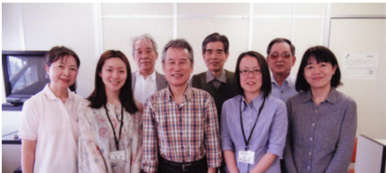
厚木保健福祉事務所・保健予防課と 神奈川支部のスタッフの皆さん

今回は会場が満席となり、質疑応答では上記以外に沢山の質問・相談がありました。内容的に難しいことも多く出され、“RP”に関する関心度はかなり高く、かつ“RP”関連情報の欠如が著しいと感じました。